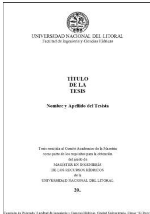
Figura 2. Carátula de la Tesis

3.2 Segunda hoja: Texto centrado, tipo Times New Roman, sin numerar. Contiene el nombre de la Universidad (en mayúsculas, tamaño 14 pt) y de las sedes académicas de la carrera (iniciales en mayúsculas, tamaño 12 pt), el título de la Tesis (en mayúsculas, negritas y tamaño 16 pt), el nombre y apellido del tesista (iniciales en mayúsculas, negritas y tamaño 14 pt). Luego, texto alineado a la izquierda, “Lugar de Trabajo:” (en negritas y tamaño 14 pt), Sigla (en mayúsculas y tamaño 14 tp), nombre del lugar de trabajo (iniciales en mayúsculas, tamaño 14 pt), “Director:” (en negritas y tamaño 14 pt), nombre y apellido del director y filiación (iniciales en mayúsculas, tamaño 14 pt), “Co-director:” (en negritas y tamaño 14 pt), nombre y apellido del director y filiación (iniciales en mayúsculas, tamaño 14 pt), “Jurado Evaluador:” (en negritas y tamaño 14 pt), nombre y apellido del Evaluador y filiación (iniciales en mayúsculas, tamaño 14 pt). El modelo de la segunda hoja (figura 3) podrá obtenerse del archivo: MIRH_Segunda Hoja Tesis.doc.